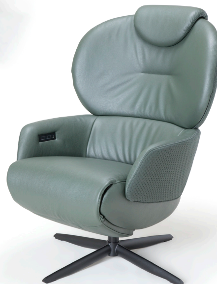
Afgebeeld: RV1023 met voet 72