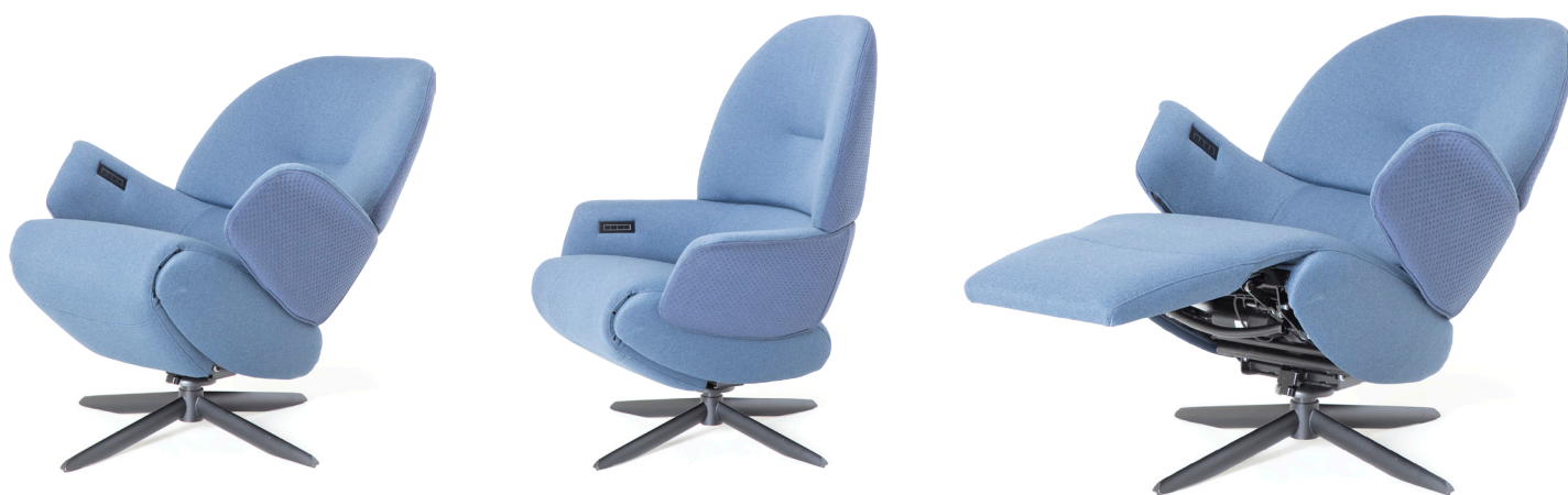
**metrages bij combi-stoffering

* Bij een fauteuil met zwarte voet wordt een zwarte tiptoetsbediening en oplaadplug ingebouwd. Bij voet 25 of voet 45 dient u de kleur van het tiptoetspaneel aan te geven.