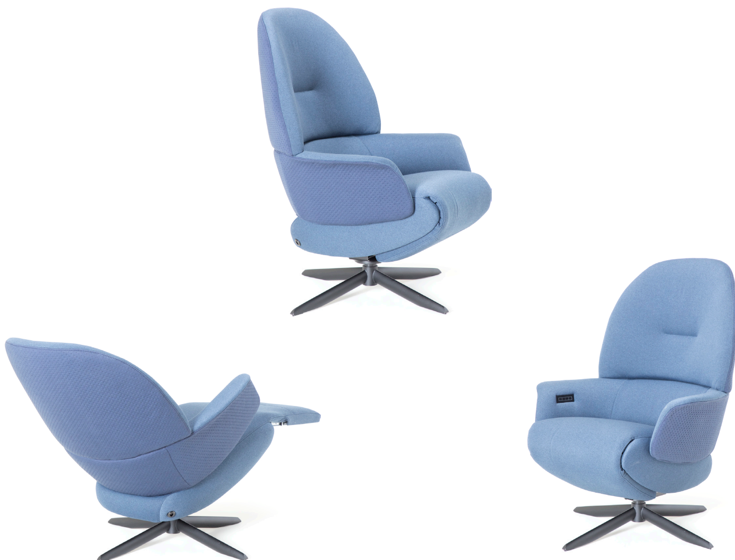
Afgebeeld: RV1022 met voet 72

Bij sommige modellen kan de rug worden uitgebreid met een opblaasbare lendensteun. Deze lendensteun is bij de handmatig verstelbare fauteuil alleen leverbaar met blaasbalg. Bij de elektrisch bedienbare fauteuil kan worden gekozen uit een handmatig - of elektrisch opblaasbare lendensteun en voor verwarming in de rug, zitting en voetklep.