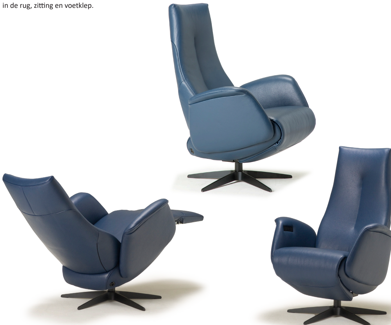
Afgebeeld: RV1017 met voet 32

De ruggen van alle Relax4u fauteuils zijn standaard voorzien van een handmatig verstelbare hoofdsteun. Als optie kan bij de fauteuil met motoren de hoofdsteun elektrisch verstelbaar bediend worden. Bij sommige modellen kan de rug worden uitgebreid met een opblaasbare lendensteun. Deze lendensteun is bij de handmatig verstelbare fauteuil alleen leverbaar met blaasbalg. Bij de elektrisch bedienbare fauteuil kan worden gekozen uit een handmatig - of elektrisch opblaasbare lendensteun en voor verwarming in de rug, zitting en voetklep.