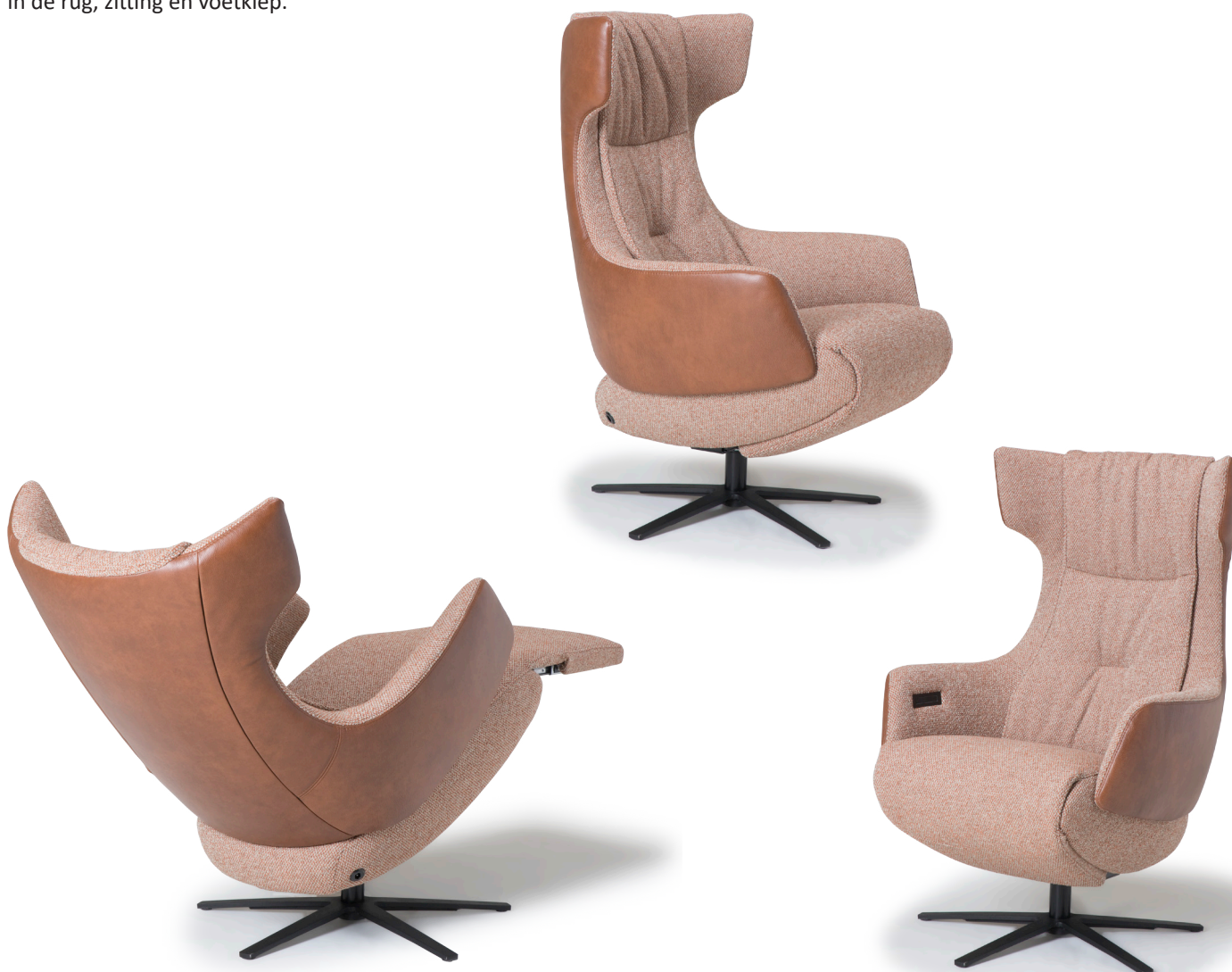
Afgebeeld: RV1011 combi met voet 87

De ruggen van alle Relax4u fauteuils zijn standaard voorzien van een handmatig verstelbare hoofdsteun. Als optie kan bij de fauteuil met motoren de hoofdsteun elektrisch verstelbaar bediend worden. Bij sommige modellen kan de rug worden uitgebreid met een opblaasbare lendensteun. Deze lendensteun is bij de handmatig verstelbare fauteuil alleen leverbaar met blaasbalg. Bij de elektrisch bedienbare fauteuil kan worden gekozen uit een handmatig - of elektrisch opblaasbare lendensteun en voor verwarming in de rug, zitting en voetklep.