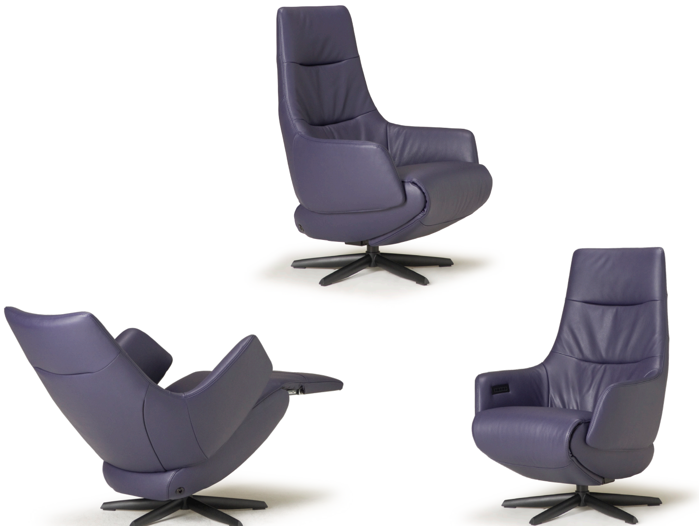
Afgebeeld: RV1009 met voet 42

De ruggen van alle Relax4u fauteuils zijn standaard voorzien van een handmatig verstelbare hoofdsteun. Als optie kan bij de fauteuil met motoren de hoofdsteun elektrisch verstelbaar bediend worden. Bij sommige modellen kan de rug worden uitgebreid met een opblaasbare lendensteun. Deze lendensteun is bij de handmatig verstelbare fauteuil alleen leverbaar met blaasbalg. Bij de elektrisch bedienbare fauteuil kan worden gekozen uit een handmatig - of elektrisch opblaasbare lendensteun en voor verwarming in de rug, zitting en voetklep.