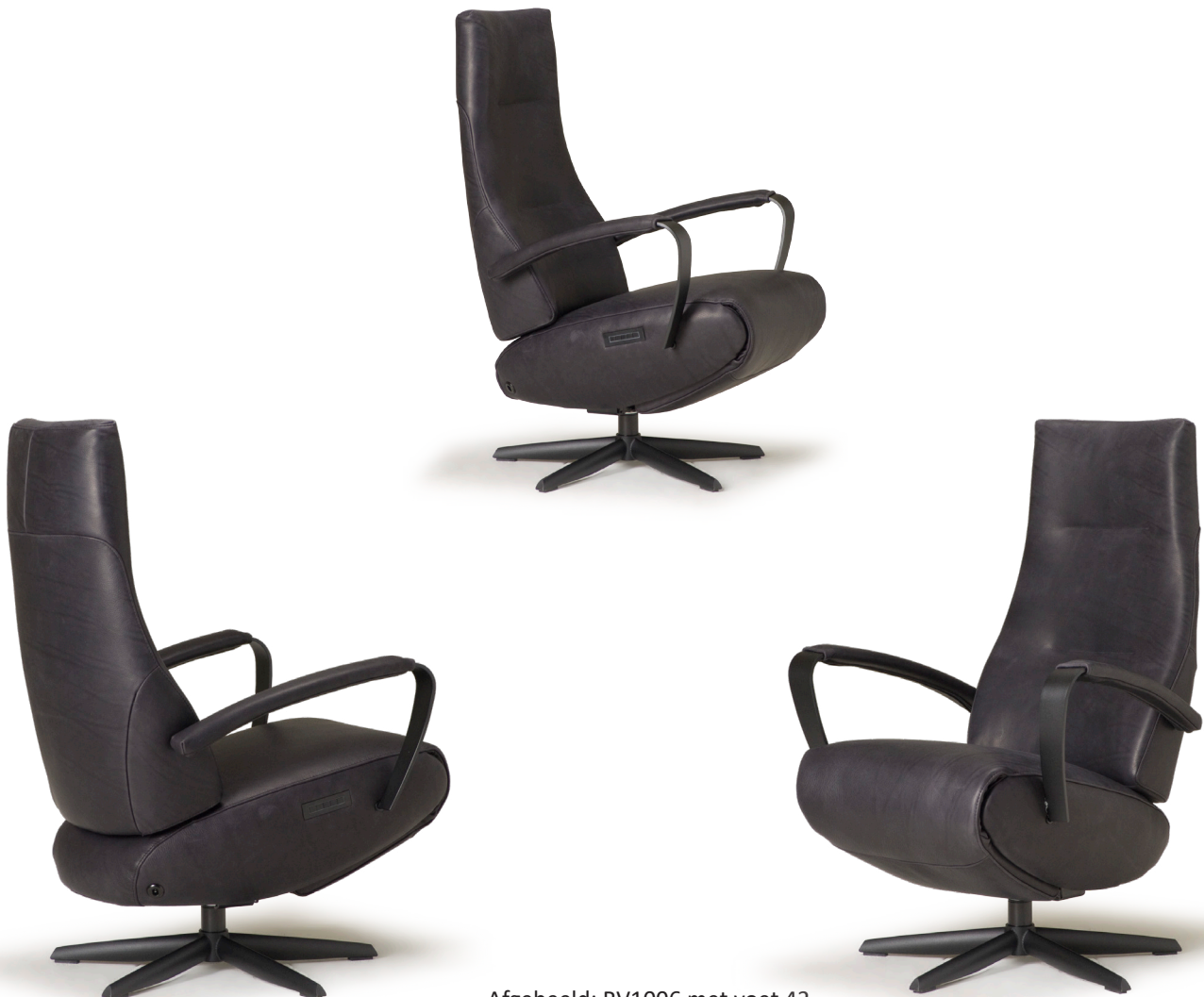
Afgebeeld: RV1006 met voet 42

De ruggen van alle Relax4u fauteuils zijn standaard voorzien van een handmatig verstelbare hoofdsteun. Als optie kan bij de fauteuil met motoren de hoofdsteun elektrisch verstelbaar bediend worden. Bij sommige modellen kan de rug worden uitgebreid met een opblaasbare lendensteun. Deze lendensteun is bij de handmatig verstelbare fauteuil alleen leverbaar met blaasbalg. Bij de elektrisch bedienbare fauteuil kan worden gekozen uit een handmatig - of elektrisch opblaasbare lendensteun en voor verwarming in de rug, zitting en voetklep.