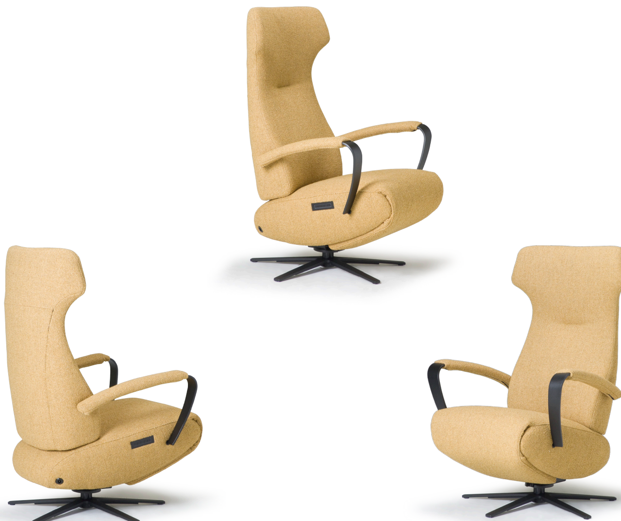
Afgebeeld: RV1002 met voet 87

De ruggen van alle Relax4u fauteuils zijn standaard voorzien van een handmatig verstelbare hoofdsteun. Als optie kan bij de fauteuil met motoren de hoofdsteun elektrisch verstelbaar bediend worden. Bij sommige modellen kan de rug worden uitgebreid met een opblaasbare lendensteun. Deze lendensteun is bij de handmatig verstelbare fauteuil alleen leverbaar met blaasbalg. Bij de elektrisch bedienbare fauteuil kan worden gekozen uit een handmatig - of elektrisch opblaasbare lendensteun en voor verwarming in de rug, zitting en voetklep.