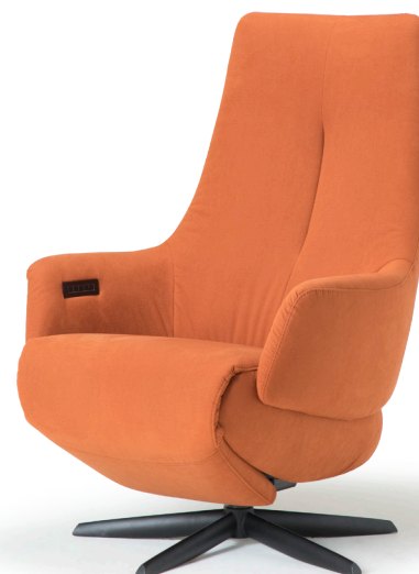
Afgebeeld: RV1001 (3M) met voet 42