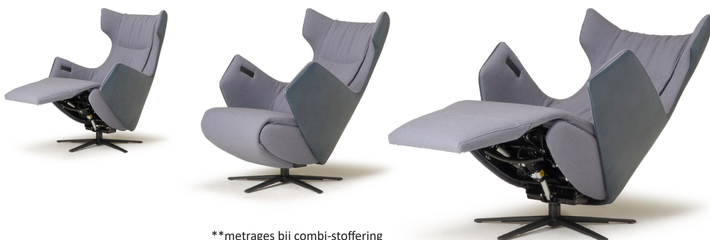
**metrages bij combi-stoffering

* Bij een fauteuil met zwarte voet wordt een zwarte tiptoetsbediening en oplaadplug ingebouwd. Bij voet 25 of voet 45 dient u de kleur van het tiptoetspaneel aan te geven.