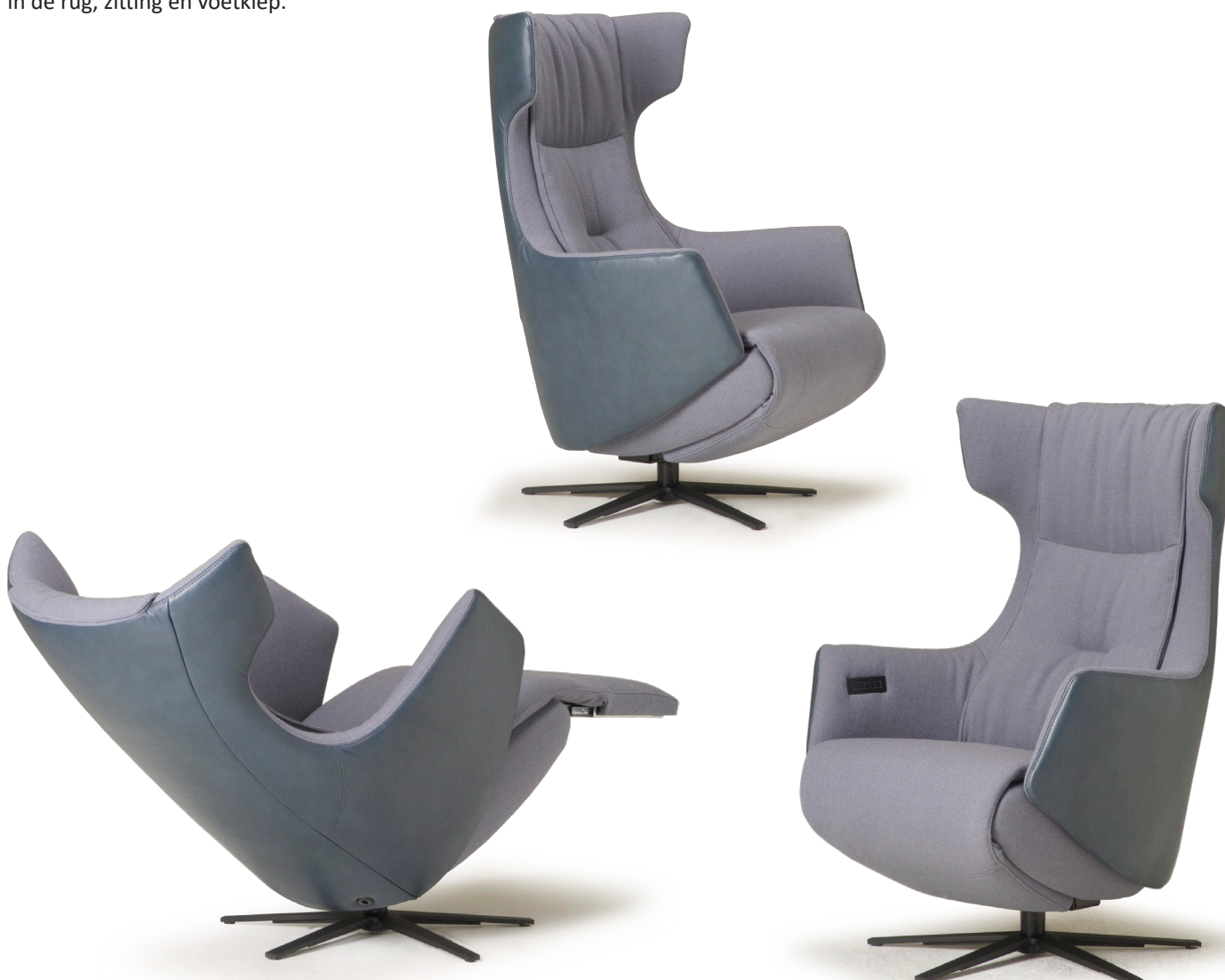
Afgebeeld: NV1011 met voet 87 (combi-stoffering)

De ruggen van alle Relax4u fauteuils zijn standaard voorzien van een handmatig verstelbare hoofdsteun. Als optie kan bij de fauteuil met motoren de hoofdsteun elektrisch verstelbaar bediend worden. Bij sommige modellen kan de rug worden uitgebreid met een opblaasbare lendensteun. Deze lendensteun is bij de handmatig verstelbare fauteuil alleen leverbaar met blaasbalg. Bij de elektrisch bedienbare fauteuil kan worden gekozen uit een handmatig - of elektrisch opblaasbare lendensteun en voor verwarming in de rug, zitting en voetklep.